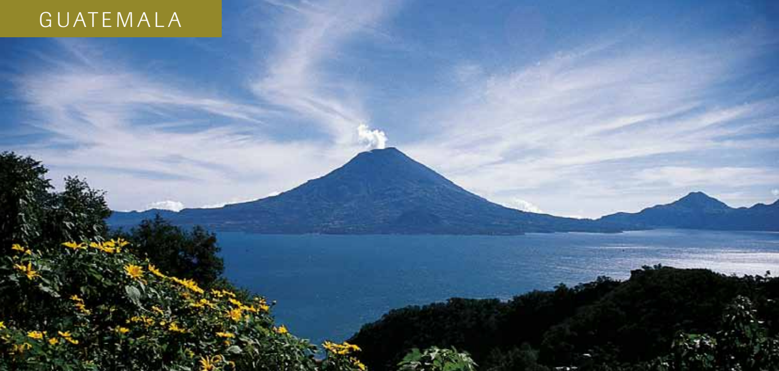
Eindrückliche Kulisse des Atitlán-Sees ist der gleichnamige Vulkan