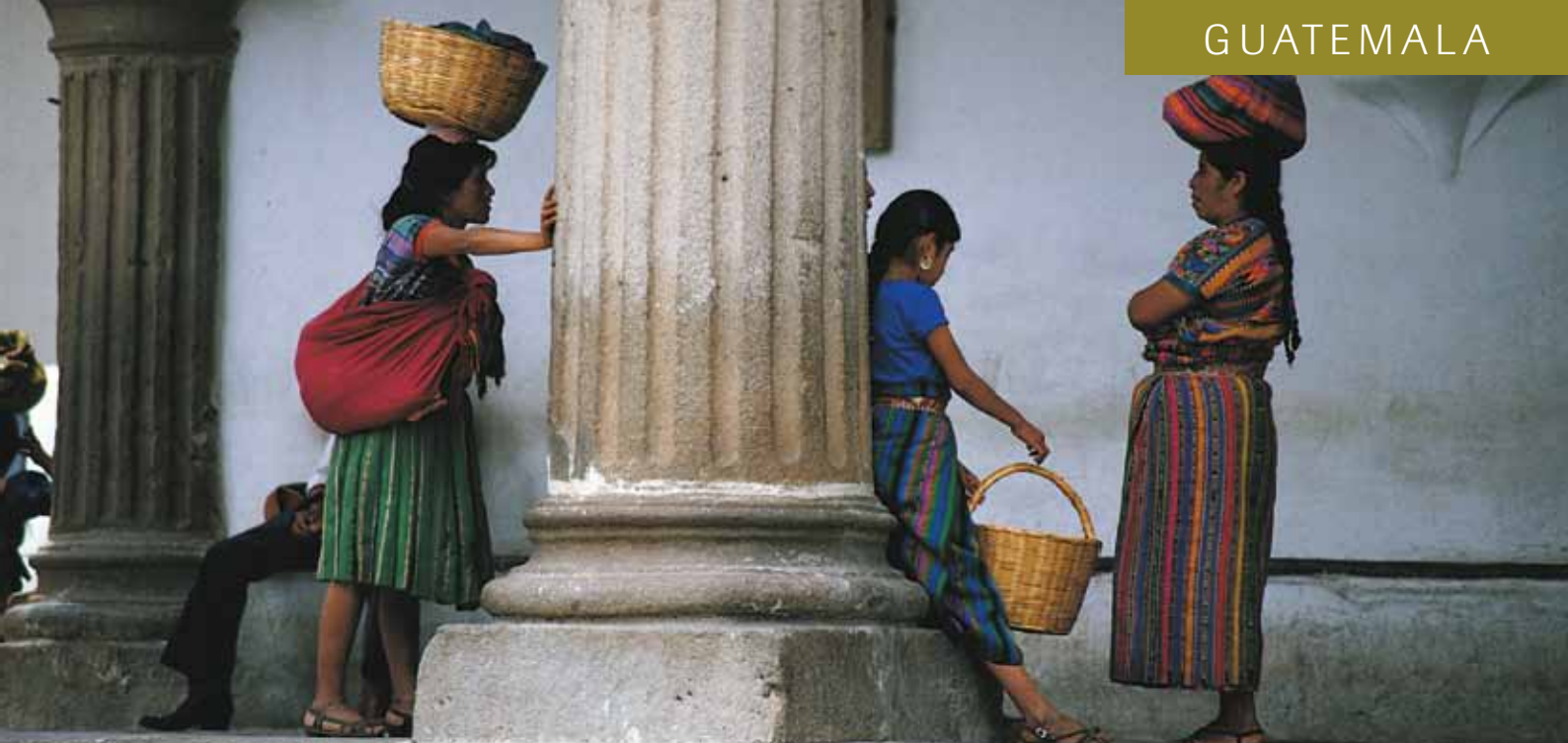
Maya-Kultur und koloniales Erbe sind in Guatemala allgegenwärtig

der frühesten Maya-Siedlungen. Am nächsten Tag Rückfahrt über die Südroute zurück nach Antigua.